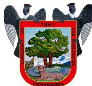
Municipalidad de Pomabamba