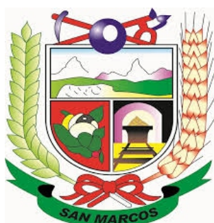
Municipalidad de San Marcos